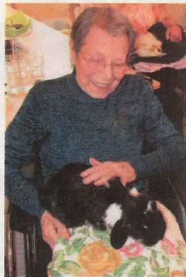
Freude pur verspüren die Heimbewohner bei der Begegnung mit Tieren.